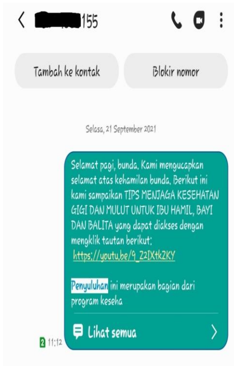
Diseminasi Layanan AKU GIGI melalui WhatsApp dan Pesan Singkat Ke Pasien