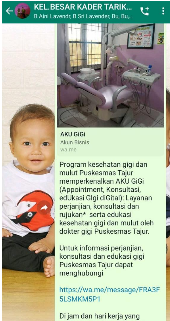
Diseminasi informasi layanan AKU GIGI melalui whatsapp group Kader Desa