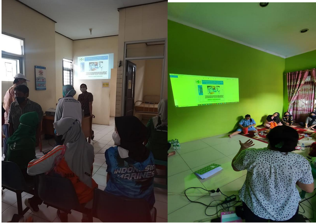
Diseminasi informasi mengenai layanan AKU GIGI di Pustu, Posyandu, dan Sekolah